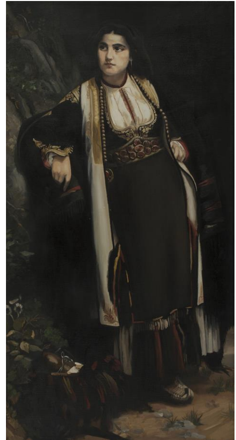
Učenički radovi iz predmeta Restauriranje i slikanje kopija