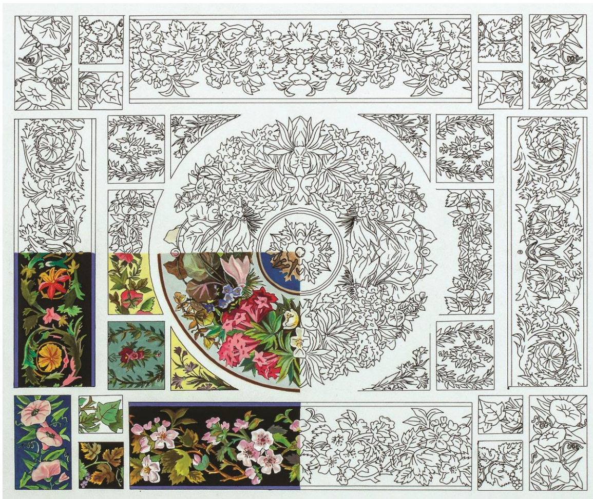
Učenički rad, kopija ornamenta izveden u sklopu predmeta Slikarske tehnike