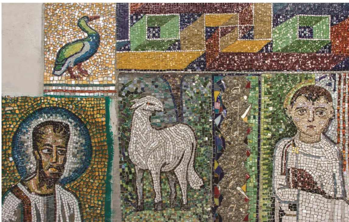
Učenički radovi na zidu odjela u tehnici mozaika izveden u sklopu predmeta Slikarske tehnike