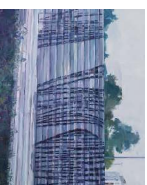
PAULINA MATYSLUK Untitled