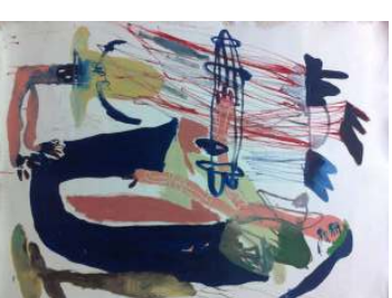
ANYA INNOKENTEVA Untitled