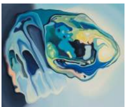
URSZULA KULCZYK Materia