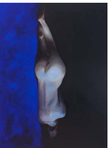
PIOTR STAROŚCIC Untitled II