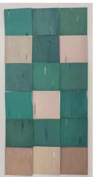
MIKOŁAJ KOWALSKI Gerhard's Floor