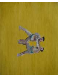
ALICE KEMP Sumo wrestling