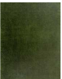
ZANE TUČA Vastness