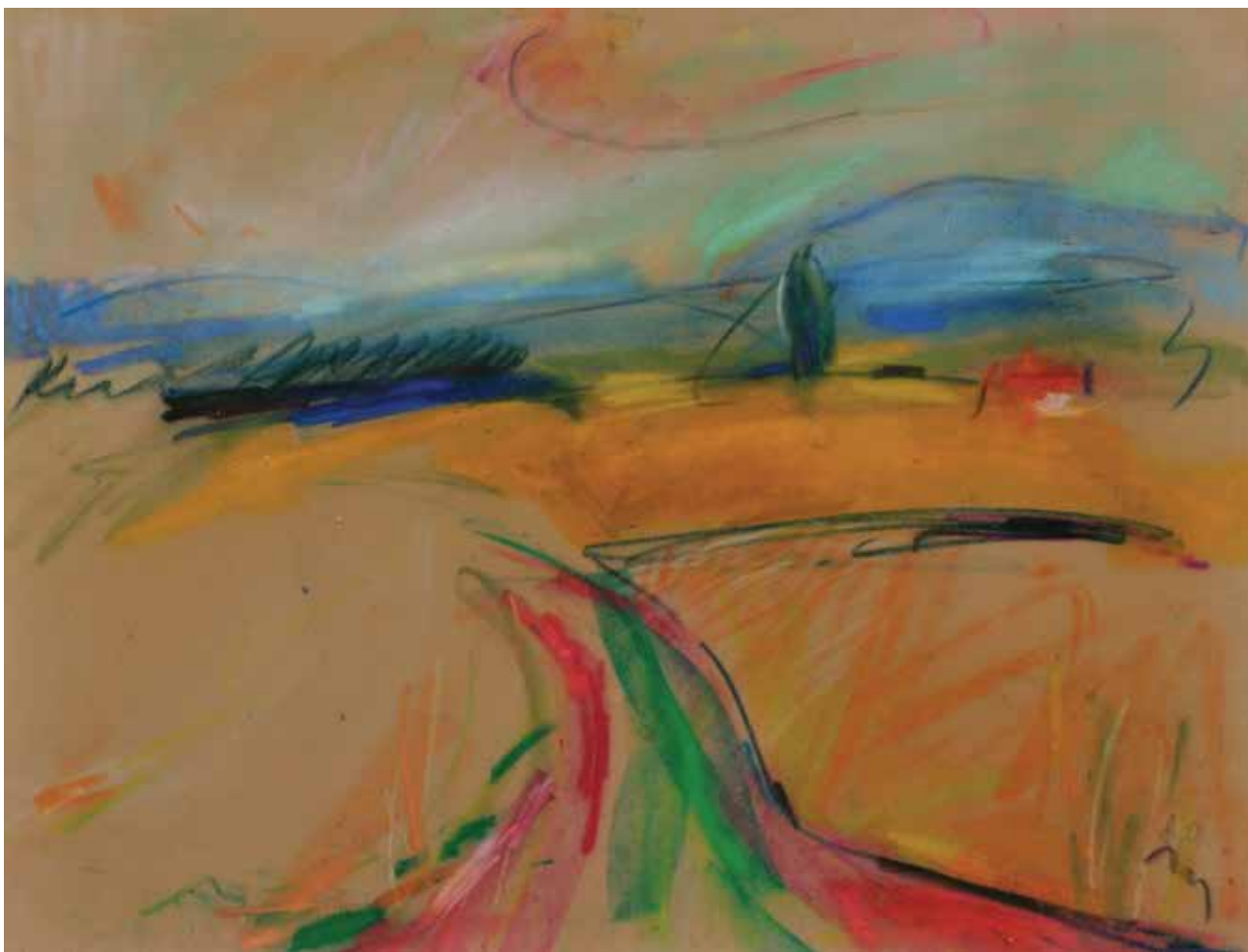
Iznad Martinščine , 34 × 45 cm, 2006.