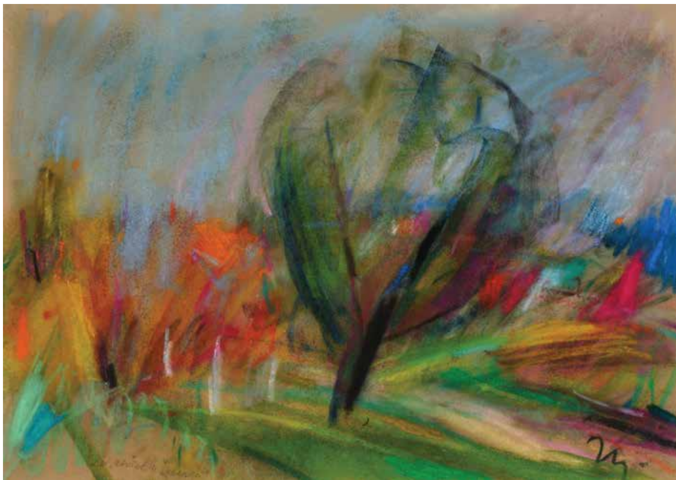
Kruška u Vugradcu, 35 × 50 cm, 2013.