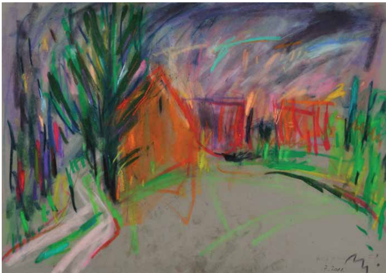
Kuća u Marincima II , 35 × 50 cm, 2011.