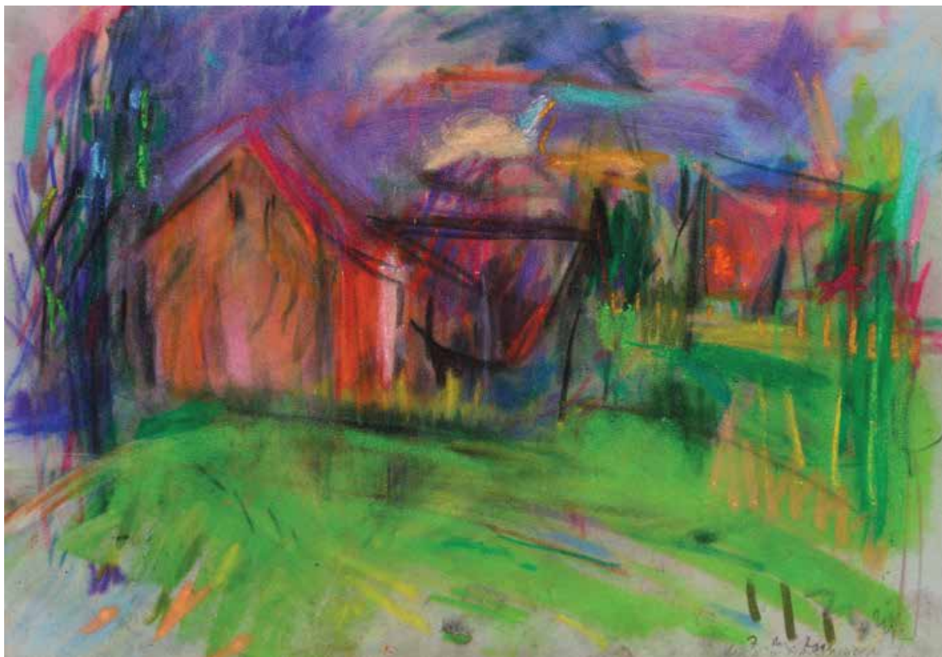
Kuća u Marincima I , 33 × 48 cm, 2011.