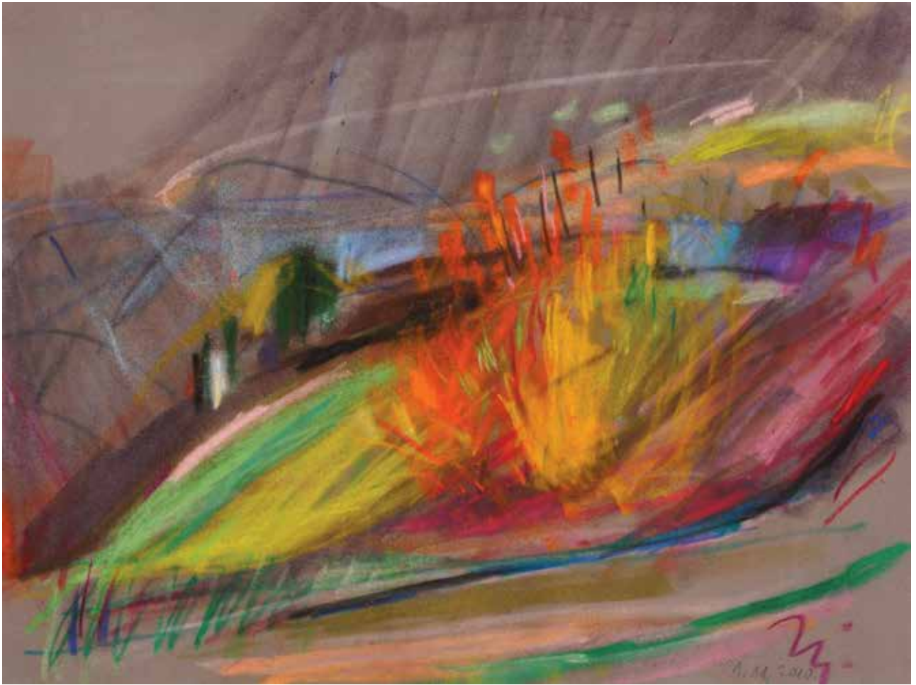
Prema Loboru , 34 × 45 cm, 2010.