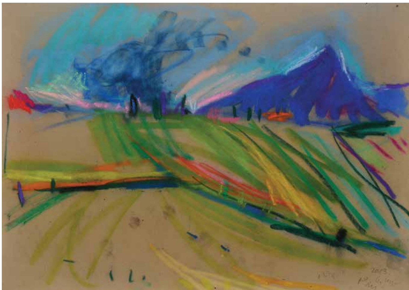
Oštrc , 35 × 50 cm, 2013.