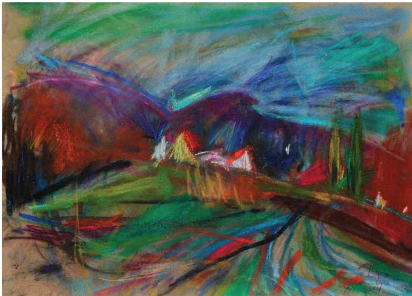
Selo Stažniki, 35 × 50 cm, 2014.