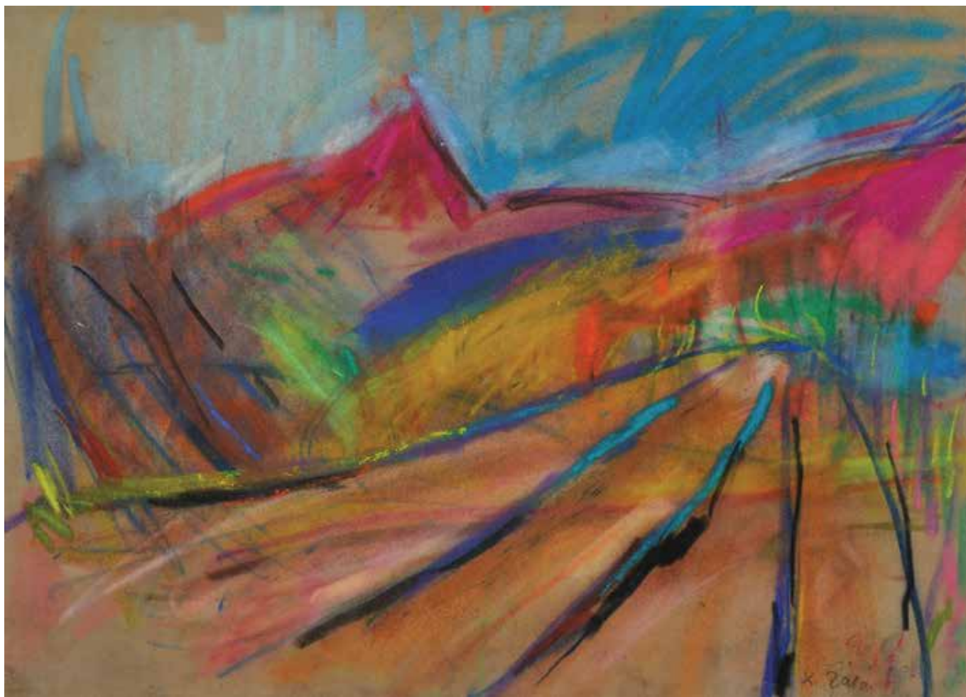
Ispod Oštrca , 33 × 44 cm, 2010.