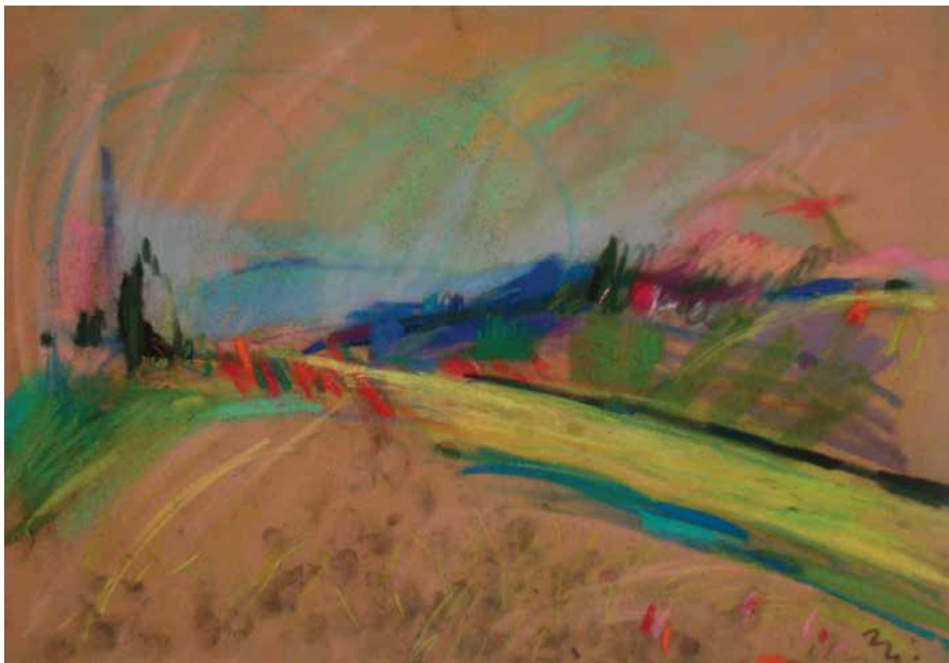
Kraj Martinščine, 33 × 48 cm, 2014.