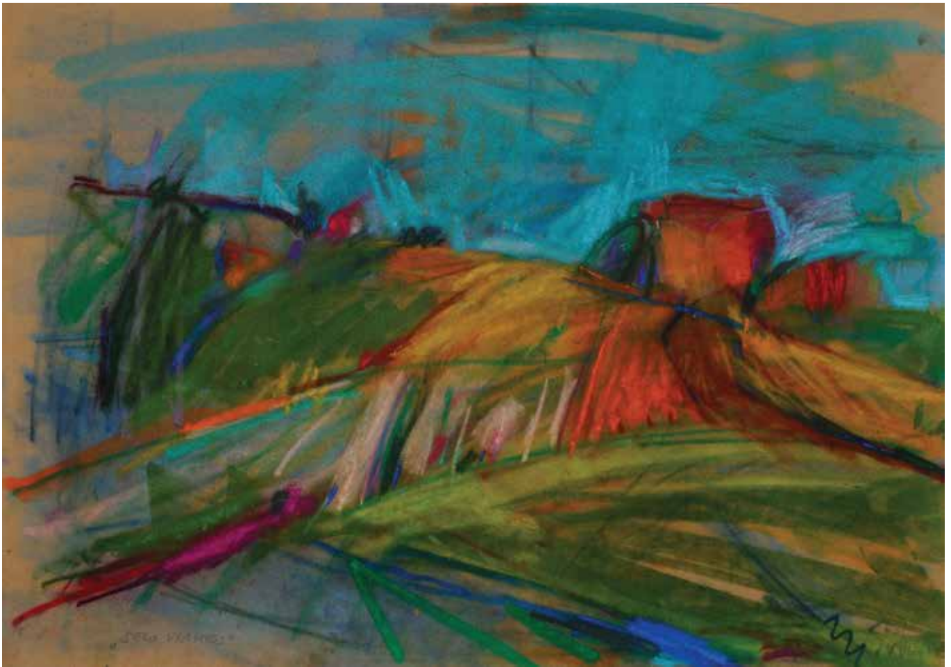
Selo Vlaheki , 34 × 50 cm, 2013.