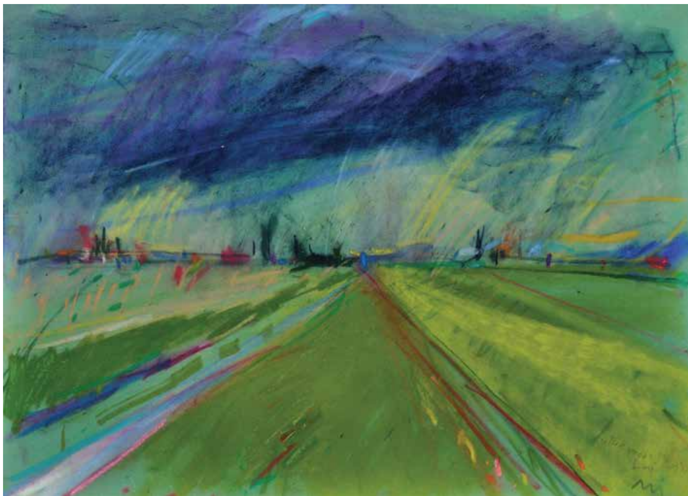
Turopolje , 34 × 48 cm, 2013.