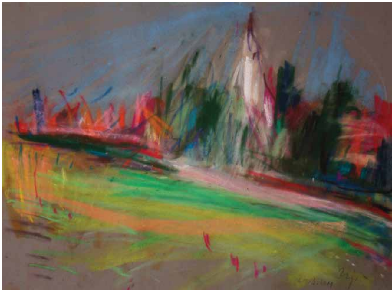
Kapela u Lovrečanu, 34 × 45 cm, 2011.