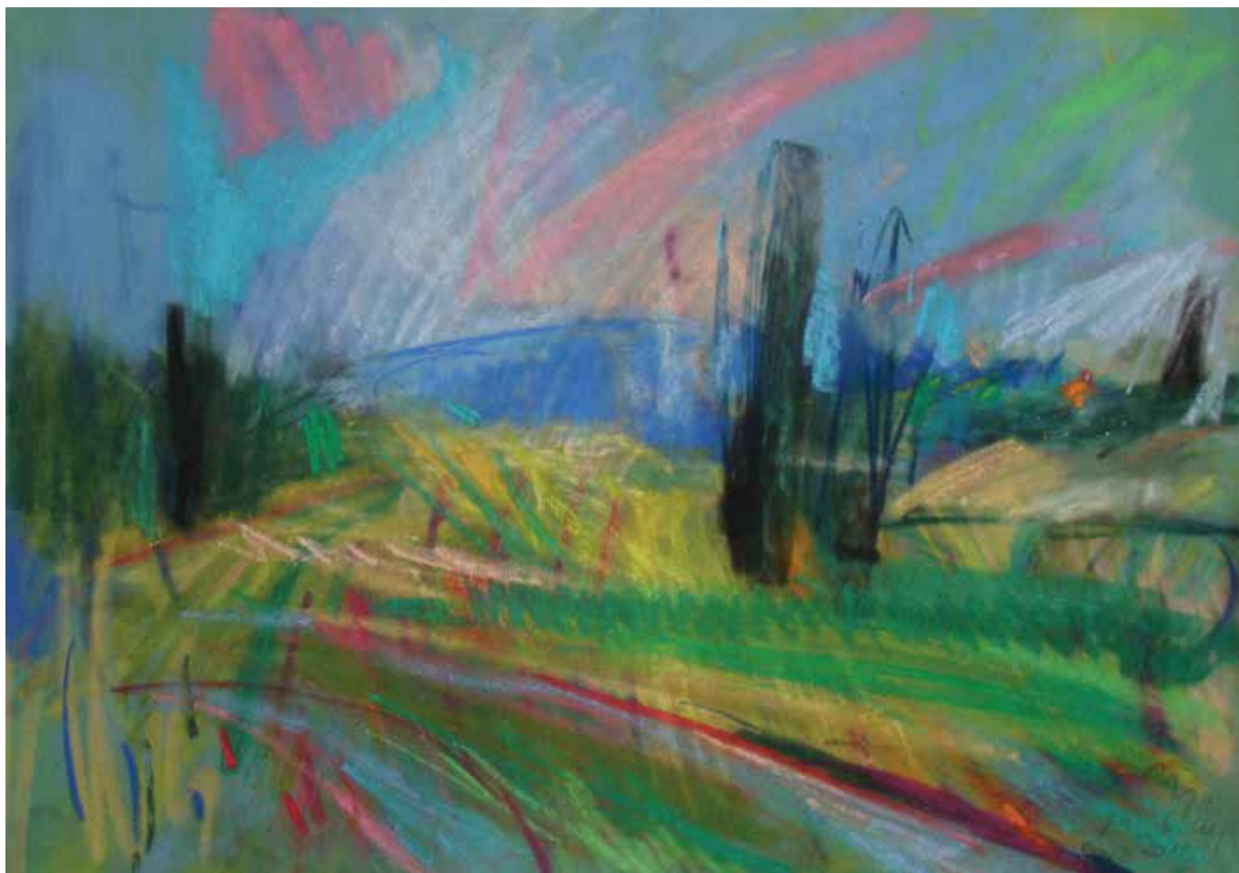
Jablani , 33 × 46 cm, 2013.