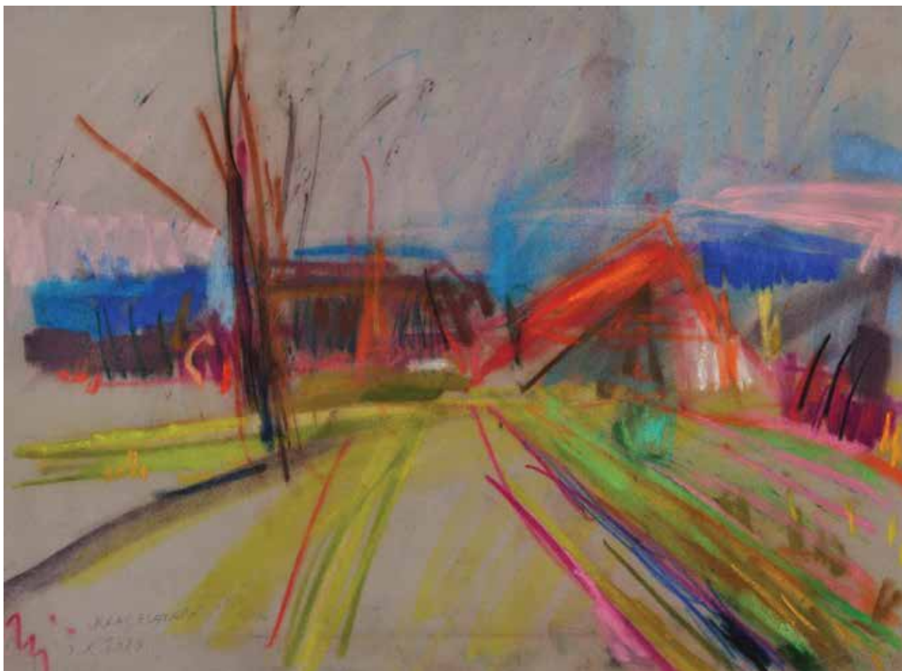
Kraj Zlatara, 34 × 47 cm, 2010.