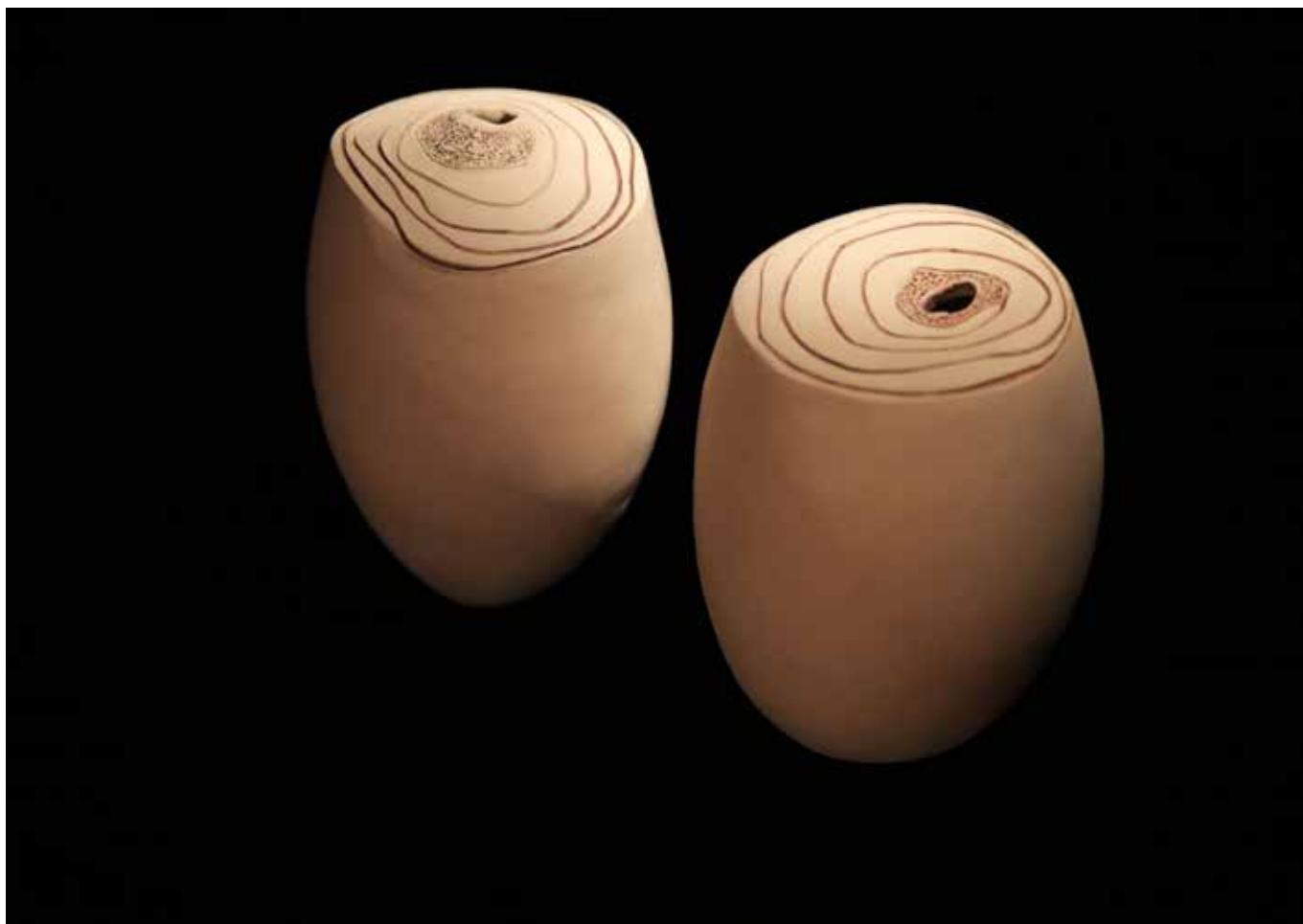
Dvije plodine , 2014., keramika (šamotirana masa i engoba), 1. v. 23 cm, Ø 15 cm; 2. v. 22 cm, Ø 15,5 cm