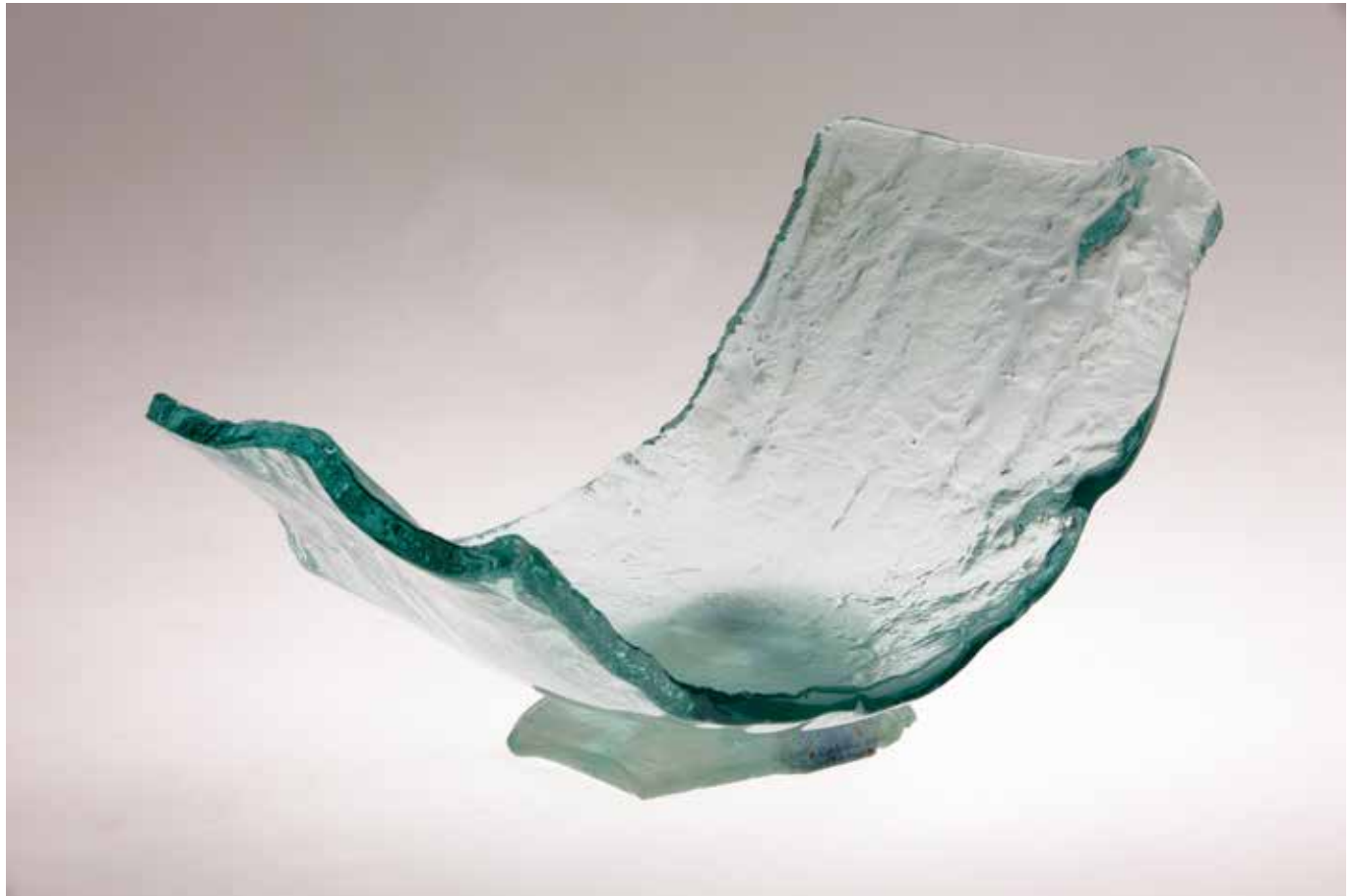
Sama , 2014., fuzija stakla, 64 x 40 cm