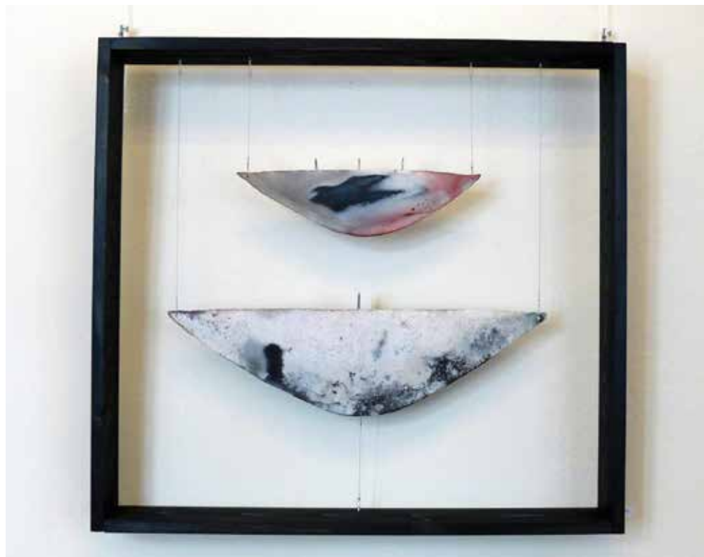
MARS AND NEPTUNE, wood, clay, 58 x 63 cm

Sudjelovala je na umjetničkim kolonijama u Austriji i Hrvatskoj (Burgstein, Varaždin, Karlobag, Plemenitaš), a 2010. godine boravila je u Evoramonteu u Portugalu u rezidenciji za umjetnike. Organizira brojne radionice iz područja primitivnih tehnika paljenja keramike kao što su pit firing i smoke firing .