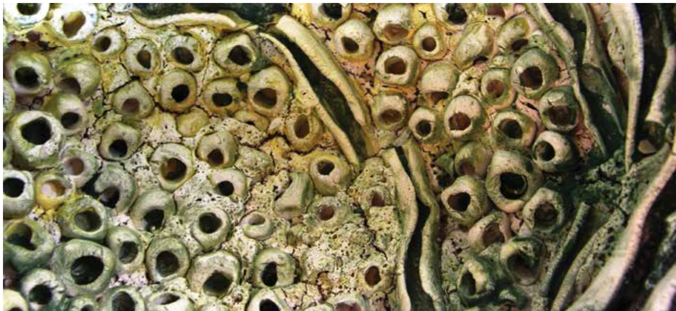
Zelene strukture , 2014. (detalj)

NADICA EICHORN rođena u 1950. U Zagrebu. Po obrazovanju diplomirani inženjer kemijske tehnologije. Likovnim radom se bavi od 1990. U centru za kulturu i obrazovanje CKO Zagreb, stječe zvanje Oblokovatelj predmeta od gline pod vodstvom keramičarke Mirjane Rajković. Članica ULUPUH-a Zagreb. Aktivno se bavi oblikovanjem keramike i istraživanjem keramičkih tehnika u vlastitom atelieru-laboratoriju. Zagreb, Mesnička 3 • e-mail: nadica.eichhorn@zg.t-com.hr