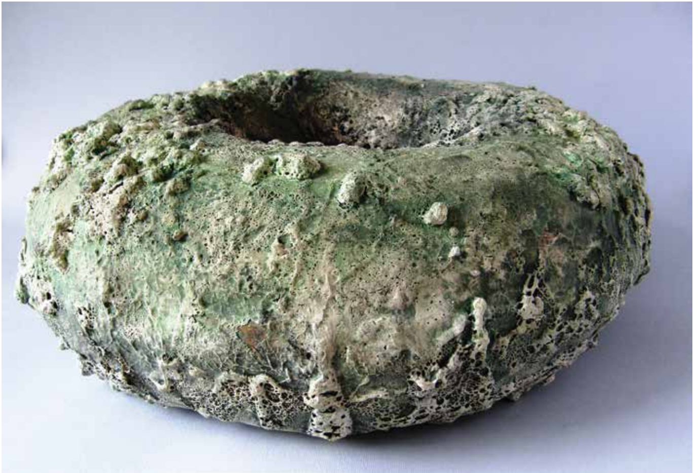
Zelene struktura , 2014., paper clay, 35 x 35 x 15 cm