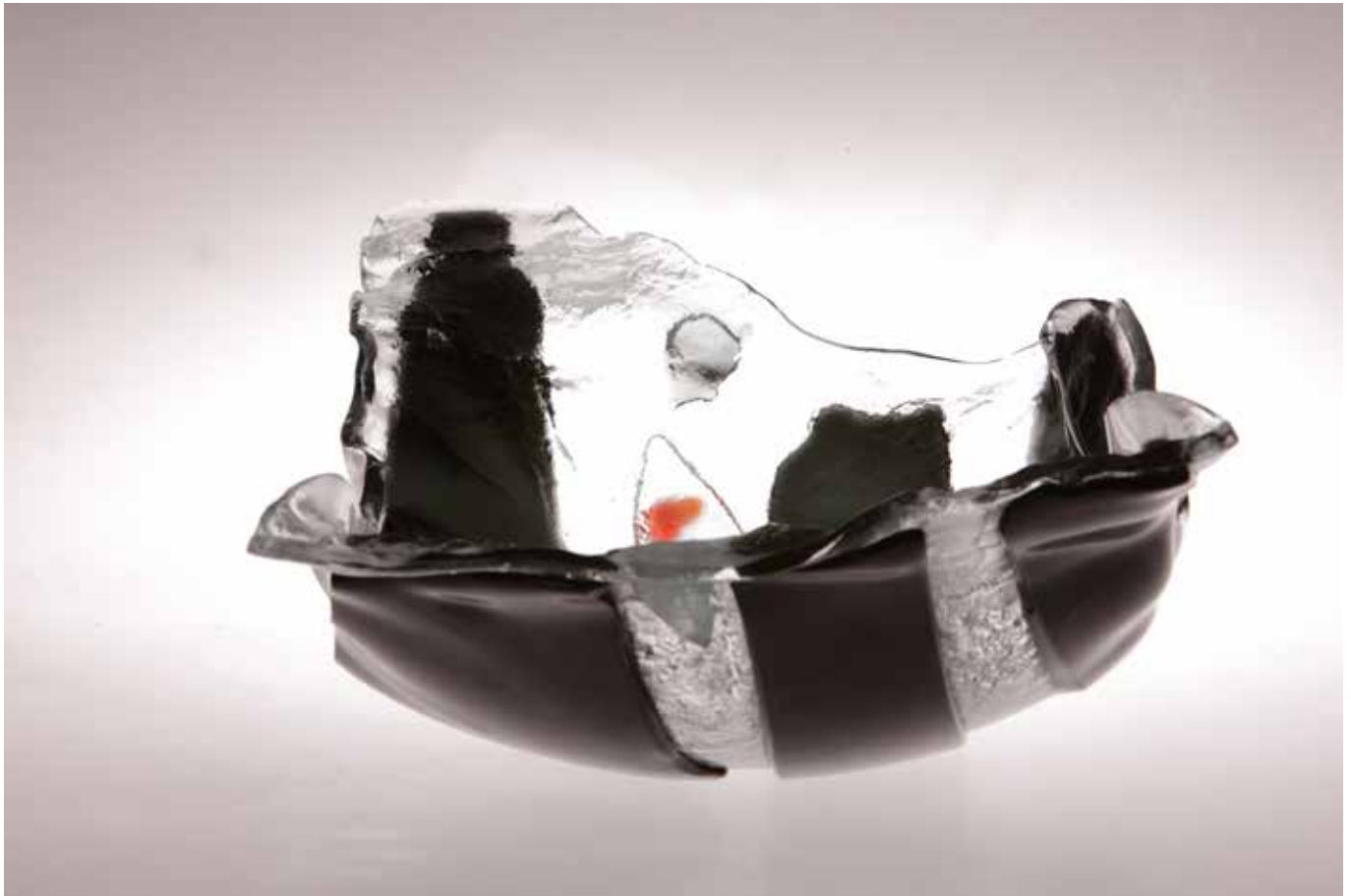
Bubimir , 2014., fuzija stakla, 82 x 43 cm