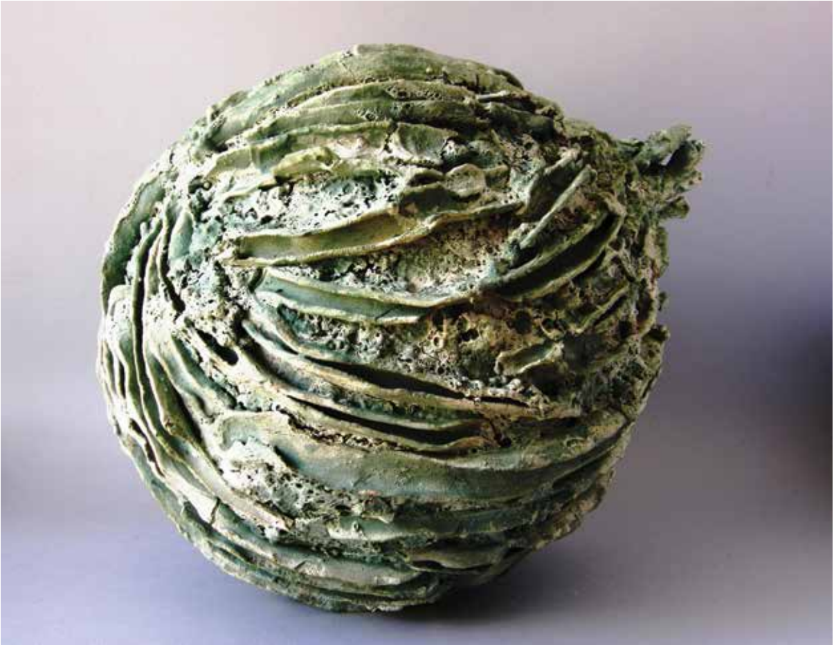
Zelene struktura , 2014., paper clay, 48 x 32 x 35 cm