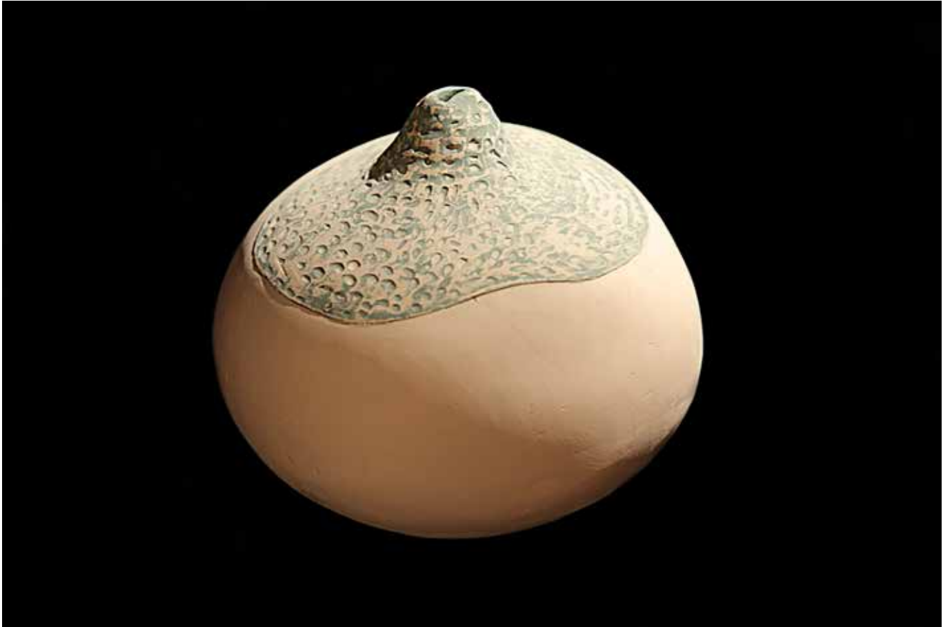
Plod iz Tiarea , 2014., keramika (šamotirana masa i engoba), v. 23 cm, Ø 21 cm