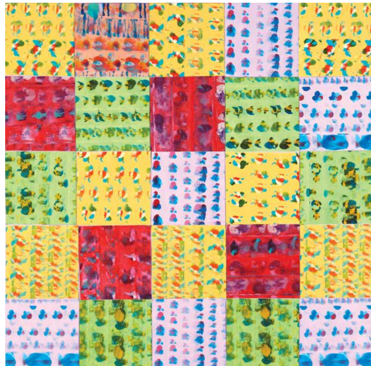
Pokrivač II , 2014., akril na platnu, 100 × 100 cm