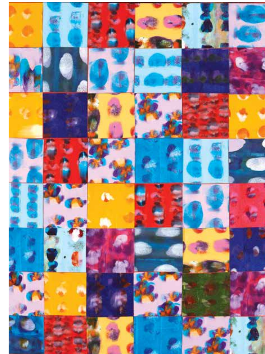
Pokrivač III , 2014., akril na platnu, 80 × 60 cm