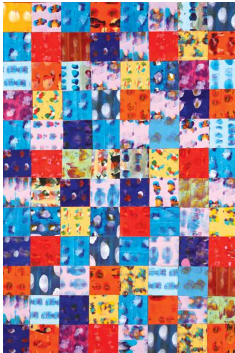
Pokrivač IV , 2014., akril na platnu, 120 × 79,5 cm

Promatrajući slike Daniele Pal Bučan, a koje ona sama – aludirajući na tehniku sastavljanja »patchworka« – naziva Pokrivačima , na pamet mi pada odlomak iz jednog teksta. Radi se o prilično poznatom radu Christophera Alexandera pod nazivom Notes on the Synthesis of Form . Teoretičar ondje govori o razlici između obrta, umjetnosti i dizajna, te implicira kako umjetnik i obrtnik nikada ne griješe, dok dizajner uvijek griješi. Razlog za to je jednostavan: obrtnik i umjetnik (svaki iz svojih razloga) nude jedinstveno i unikatno rješenje oblikovnog problema, dok dizajner polazi od pretpostavke da oblikovni problem u odnosu na funkciju dizajniranog proizvoda uvijek nudi više rješenja.