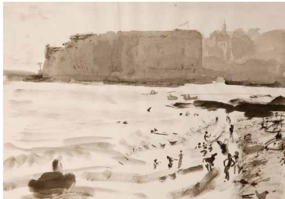
Dubrovnik, lavirani tuš, 1997.

Likovni opus Mihovila Dorotića prikazan na ovoj izložbi kreće se od 1997., kada je počeo studirati slikarstvo, prema recentnim radovima, koji potvrđuju njegovu slikarsku dosljednost. Ta se dosljednost prvenstveno ogleda u principu rješavanja likovnog zadatka , koji predstavlja temelj u razvoju slikarskog umijeća – naučiti opažati, a zatim opaženo i umjeti postaviti. To načelo gotovo da je posve izgurano van okvira umjetničke misli primjenom tehnologije, pa se Mihovilov povratak likovnoj tradiciji opažanja u prirodi čini kao neka vrsta romantičarskog bijega od novonastalih prilika u svijetu slike. Kao što su to činili pripadnici Barbizonske škole i drugi poznati nam pleneristi , tako i Mihovil svoj stvaralački izazov (impresiju) traži lutajući gradskim ambijentima ili seoskim krajolikom. U tehnikama crteža i akvarela interpretira opaženo, mareći za vjernost cjeline, ali i za ekspresivnost detalja. Oblici su često jednostavno naznačeni, a opet se doimaju kao isplanirani konstrukti, imaju masu i stvaran karakter. Kao posebna vrsnoća njegovog akvarela izdvaja se osjetilnost prema boji, kojom uprizoruje atmosferu slike i vlastitu senzaciju u njenom stvaranju. Hitar, ali kontroliran potez kistom daje slojevima slike svježinu i pokrenutost, pomičući težište od čiste deskripcije zadanih motiva prema unutarnjem estetskom doživljaju. Ključ Mihovilove slikarske senzibilnosti je užitek u rješavanju slikarskog zadatka, svojevrsna igra kojoj je krajnji cilj užitek u oku promatrača.