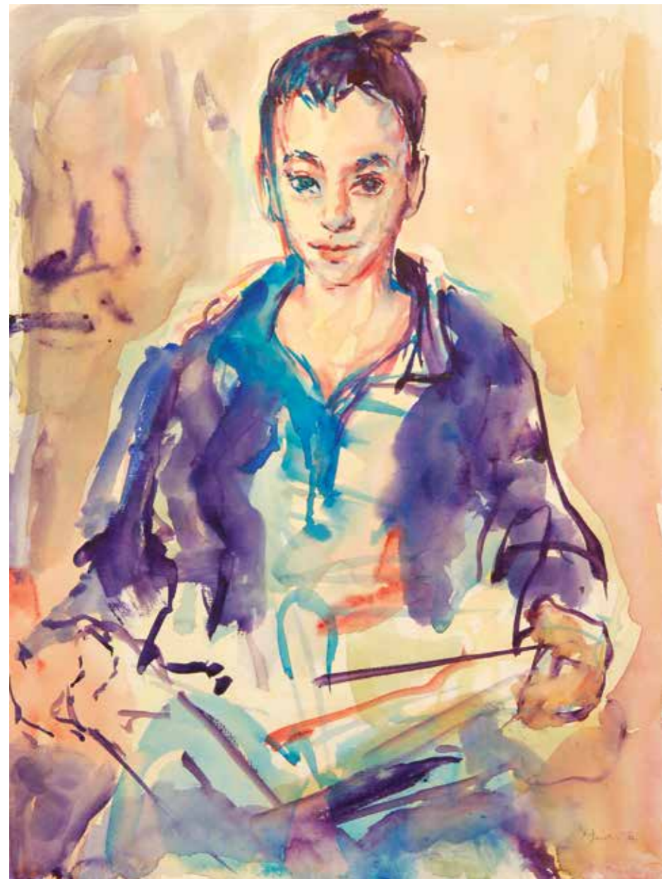
Učenica, akvarel, 2006.