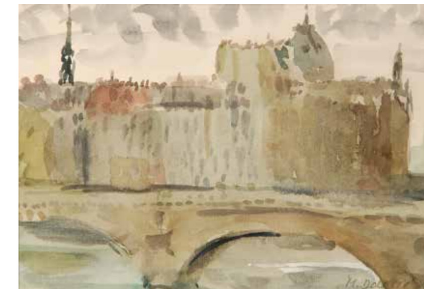
Pariz, akvarel, 1997.